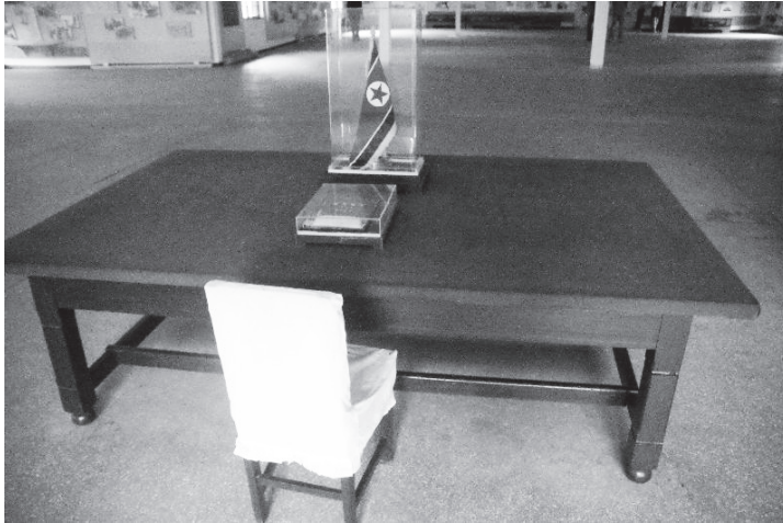
Fot. 2. Stół, przy którym w 1953 roku podpisywano rozejm między walczącymi stronami, Panmunjom, Korea Północna (2012).