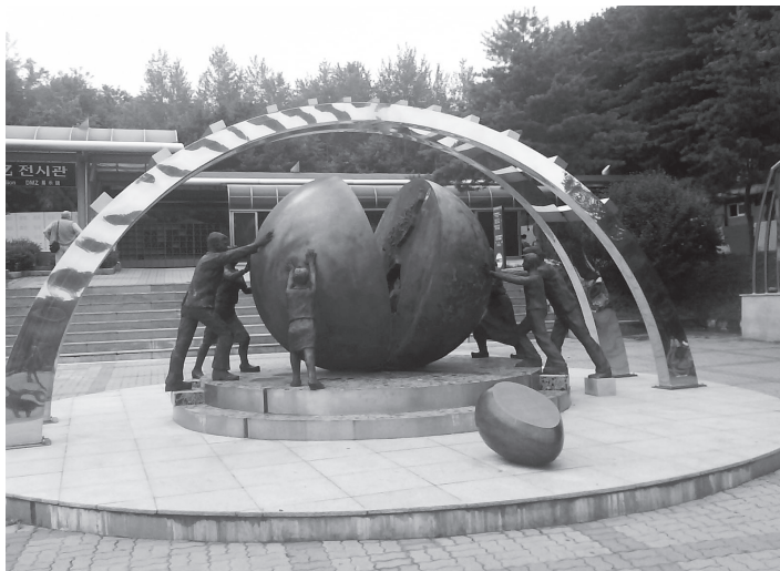
Fot. 1. Pomnik symbolizujący intencję zjednoczenia Korei, ulokowany po stronie Korei Południowej przy udostępnionym dla turystów Drugim Tunelu 1 (2007).

wykuta i zahartowana na kowadle historii z niezwykle ciekawymi efektami. Silny, produktywny, ideologicznie skonfrontowany z komunizmem i odporny na narzucanie woli politycznej naród, to ostatnia rzecz, jaką Chińczycy chcieliby mieć za miedzą.